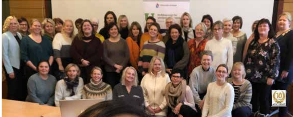
Demensnettverket i Telemark er 10 år